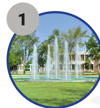
1 Αλεξάνδρεια Πανεπιστημιούπολη Δι.Πα.Ε.