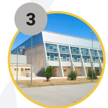
3 Πανεπιστημιακό Γυμναστήριο Δι.Πα.Ε.

Ακολουθήστε τον σύνδεσμο για οδηγίες στο χάρτη