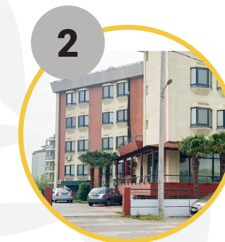
2 Β΄ Φοιτητική Εστία Δι.Πα.Ε.

Ακολουθήστε τον σύνδεσμο για οδηγίες στο χάρτη